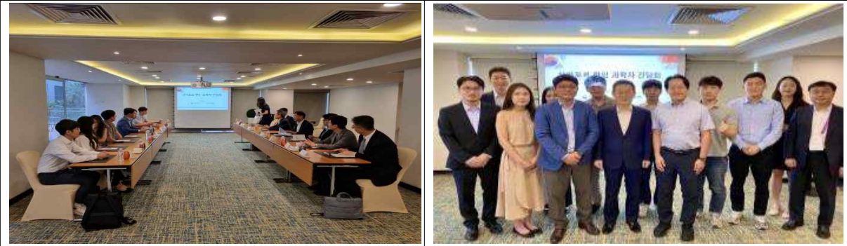
주 싱가포르 한인 과학자 간담회