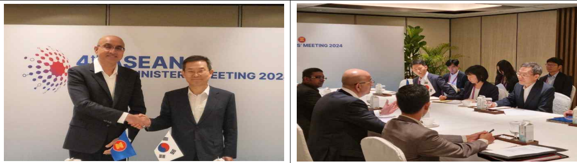
ASEAN 사무총장 미팅