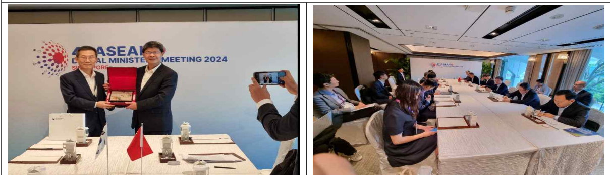
한-중 대표 회의